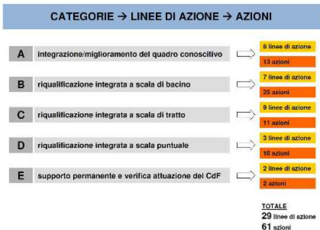
Fig. 4 – Stralcio dal Piano d'azione del Contratto di Fiume del Torrente Agogna

La proposta tecnica del piano d'azione del contratto di fiume del Torrente Agogna è articolata in categorie, a loro volta suddivise in linee di azioni che propongono delle azioni da seguire per l'attuazione del piano.