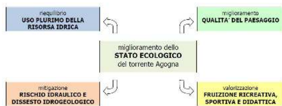
Fig. 3 – Articolazione del miglioramento dello stato ecologico del Torrente Agogna

Per questi motivi, il conseguimento dell'obiettivo ambientale viene perseguito in maniera negoziale con gli altri principali obiettivi in gioco: riduzione del rischio idrogeologico, valorizzazione della risorsa idrica per gli usi antropici, fruizione del corso d'acqua, qualità del paesaggio.