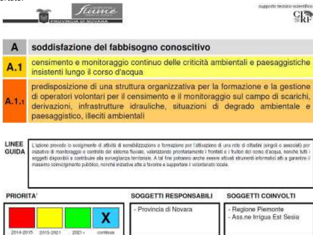
Fig. 5 – Esempio di azione contenuta all'interno del Piano d'azione del Contratto di Fiume del Torrente Agogna

Si rimanda al piano d'azione del Contratto di Fiume del Torrente Agogna la lettura delle singole schede associate alle azioni previste.